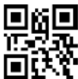
ハンズフリーモード