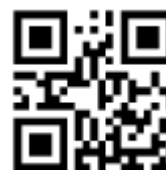
大文字→小文字、小文字→大文字