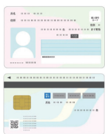
マイナンバーカード番号