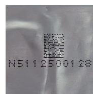
バッテリー包装印字